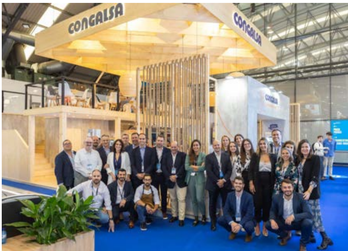
Parte de la plantilla del Grupo participando en la feria Conxemar 2024.

En conjunto, las acciones realizadas en cuanto a las relaciones sociales en el Grupo a lo largo de este año han supuesto que el 100% de las personas trabajadoras en España y Portugal están cubiertas por convenios colectivos.