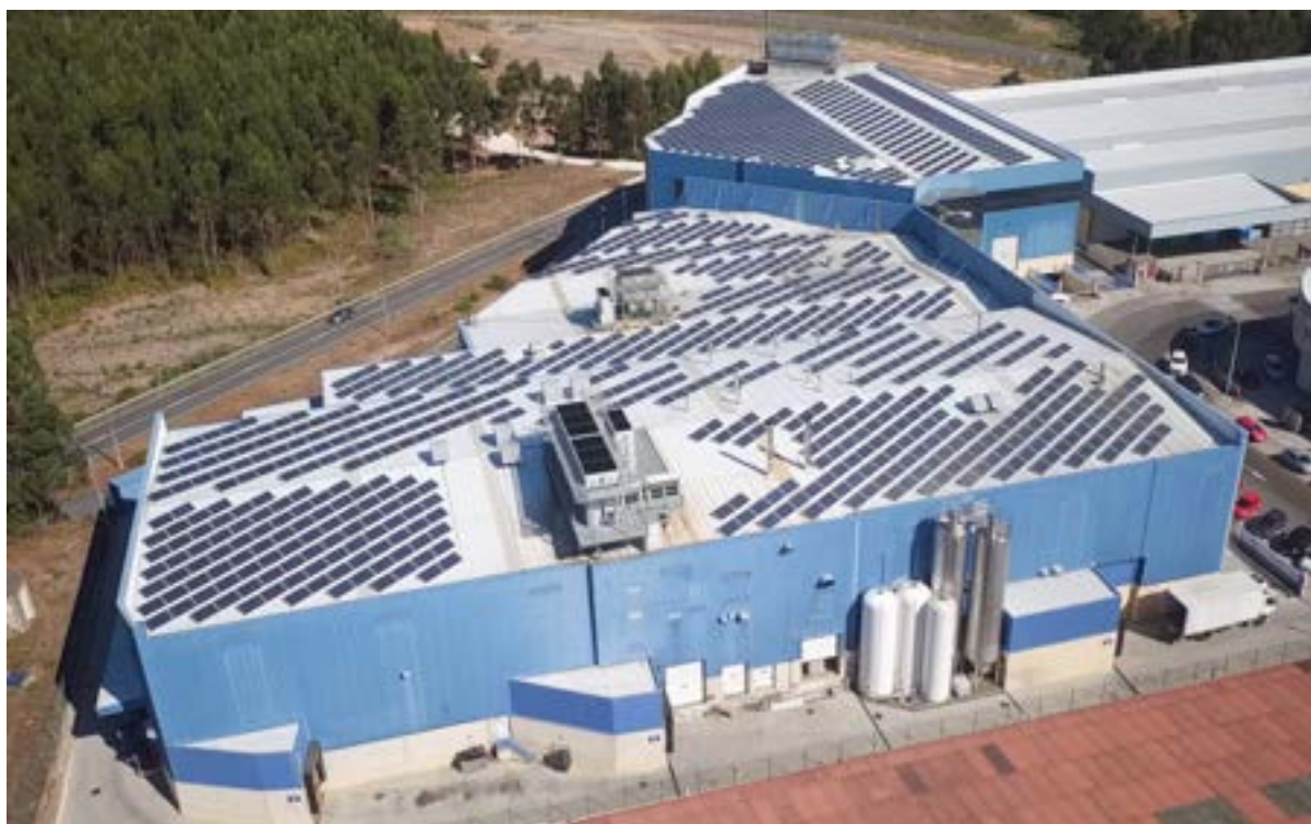
Instalación fotovoltaica de Congalsa en A Pobra do Caramiñal